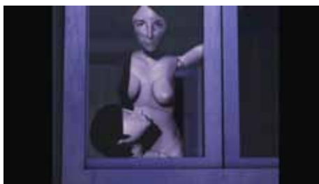
« Mamamembre » de Sylvain Payen, 7 min