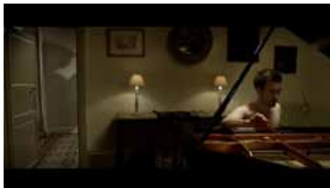
« L'Accordeur » d'Olivier Treiner, 13 min César 2012 du meilleur court métrage