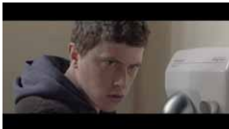
« Ce n'est pas un film de cow-boys » de Benjamin Parent, 12 min