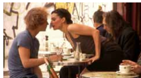
« Nana » de Pierre Boulanger, 8 min