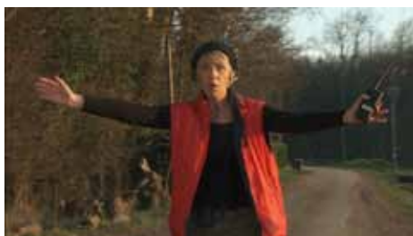
« La Vraie Vie » de Yves Osmu, 9 min