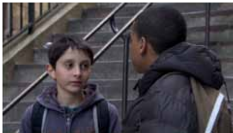
« A demi-maux » d'Alexandre Baudet-Labiano, 14 min