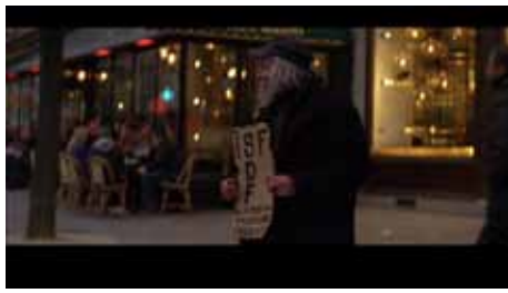
« Je pourrais être votre grand-mère » de Bernard Tanguy, 19 min